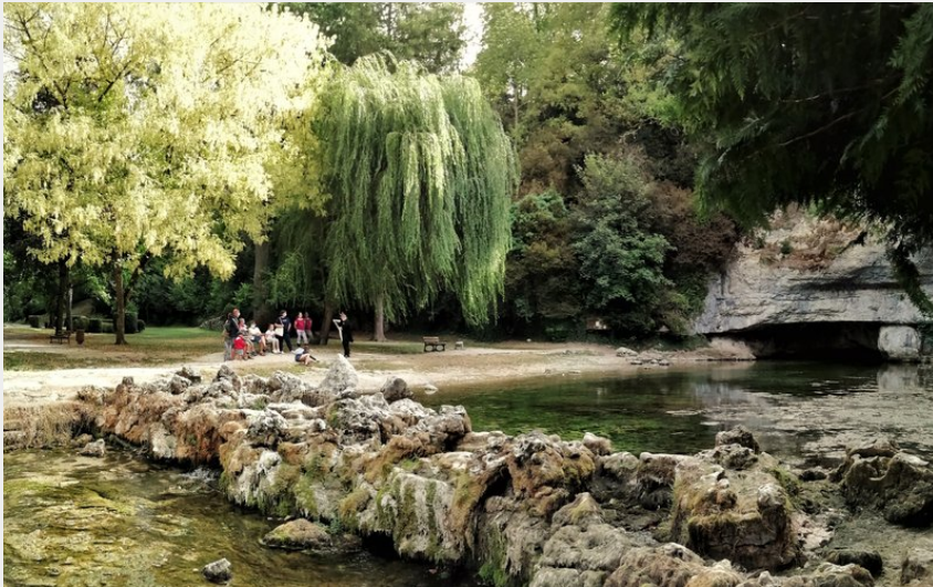
Source de la Douix - Châtillon-sur-Seine