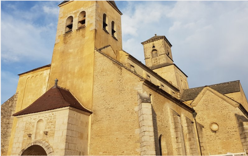
Église Saint-Vorles - Châtillon-sur-Seine