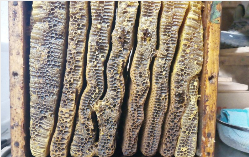
Crédit photo : Busseaut - Annette DULION apiculture (4) (Annette Dulion)