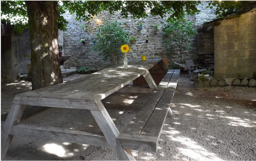
Crédit photo : Aignay-le-Duc - Gîte de groupe Maison Michaut (Jardin)