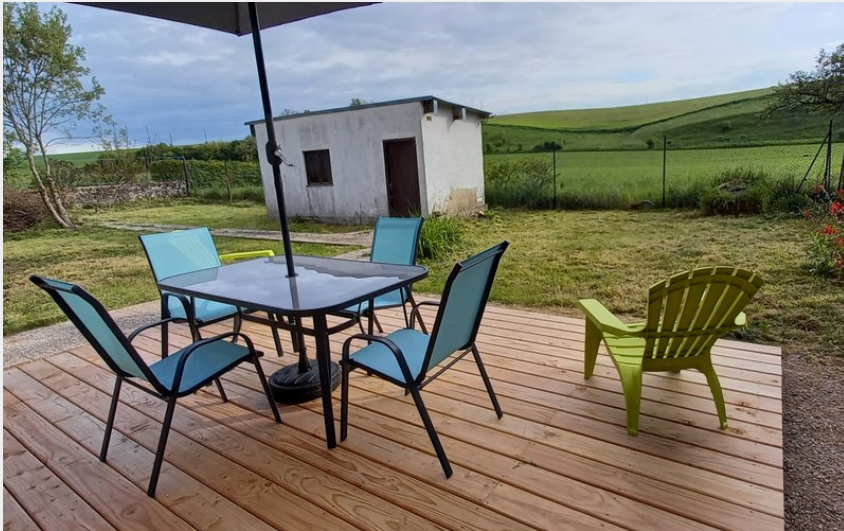
Crédit photo : Gîte Au temps retrouvé - Terrasse vue sur champ (Isabelle Bouvet-Maréchal)