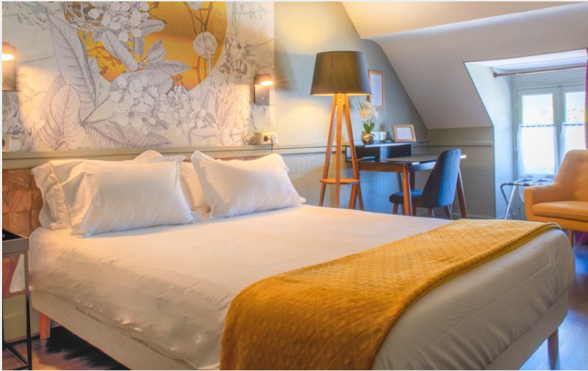
Crédit photo : Chambre double confort Hotel du Roy (Clarisse Vinot)