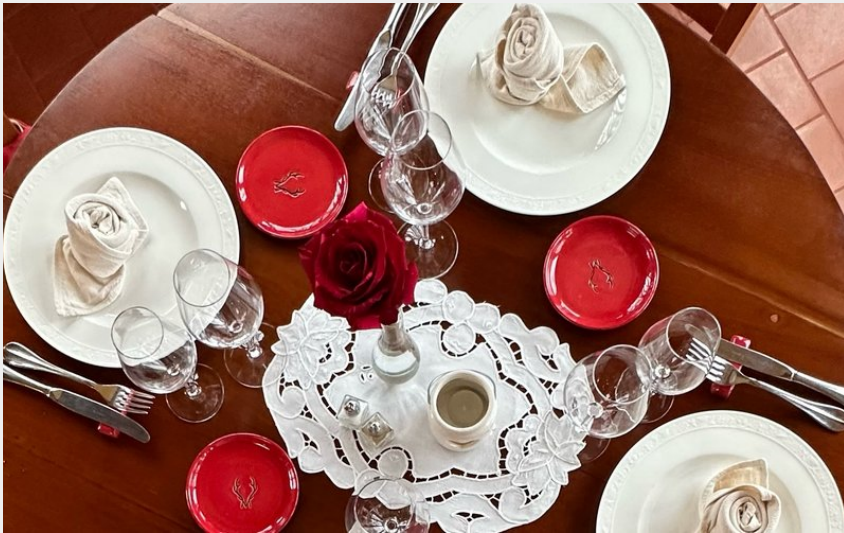
RIEL-LES-EAUX - Restaurant L'Armoise