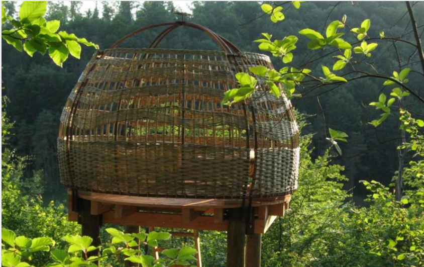
(Le Nid d'Amorey, perché dans la verdure)