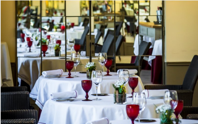
(Salle du restaurant de Chateau de Courban)