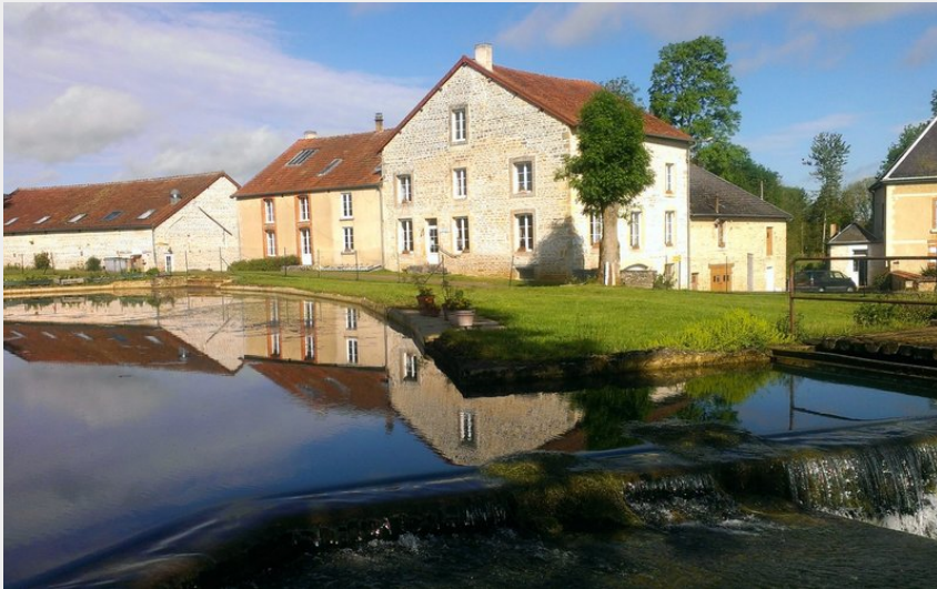
Crédit photo : © Moulin de la Fleuristerie (Vue du Moulin de la Fleuristerie)