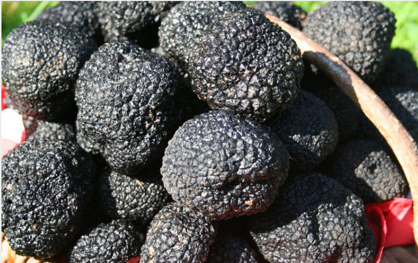
Crédit photo : IMG_2870 Panier récolte uncinatum (christine dupaty)