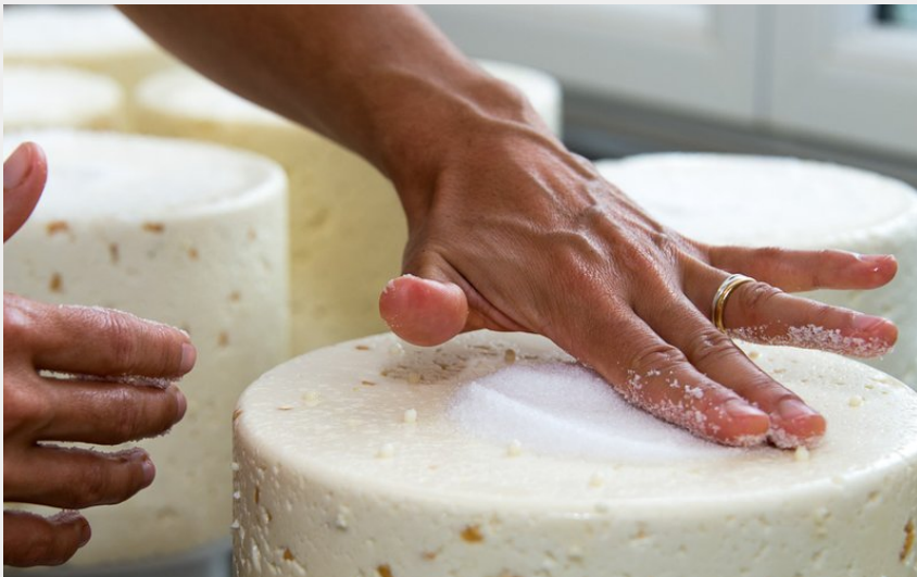
(Fabrication au GAEC de Conclois)