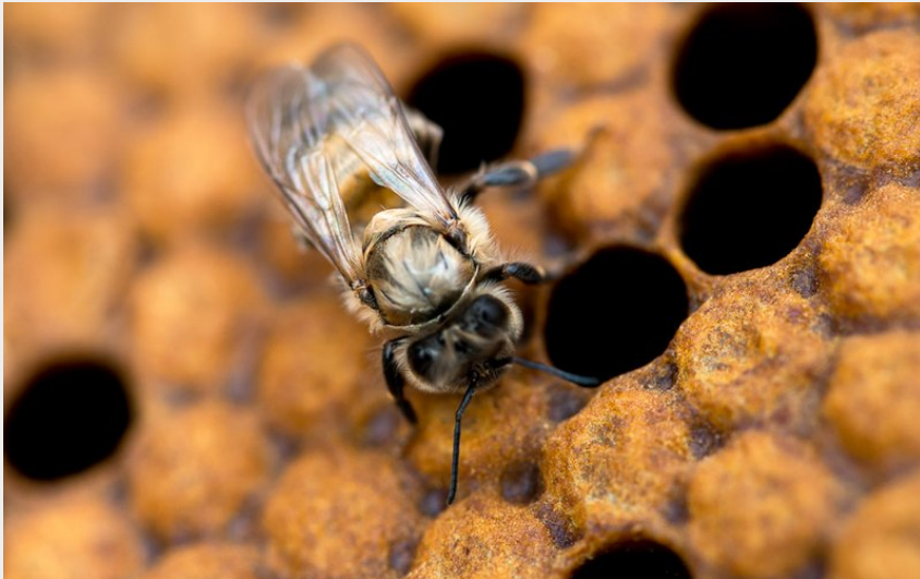
(Abeille du rucher du Barrois)