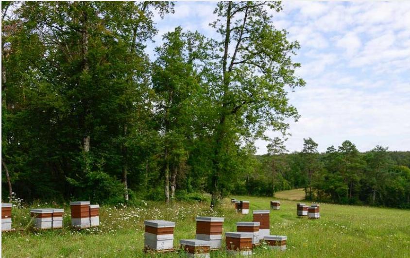
(Ruches au rucher du Barrois)