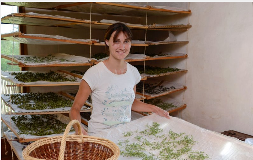
(Herberie de la Tille, atelier)