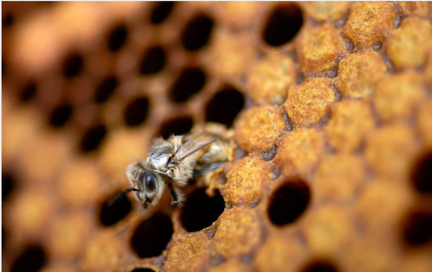
(Abeille du rucher du Barrois)