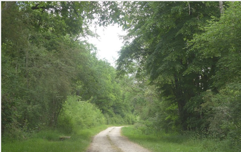
Chemin des Lames