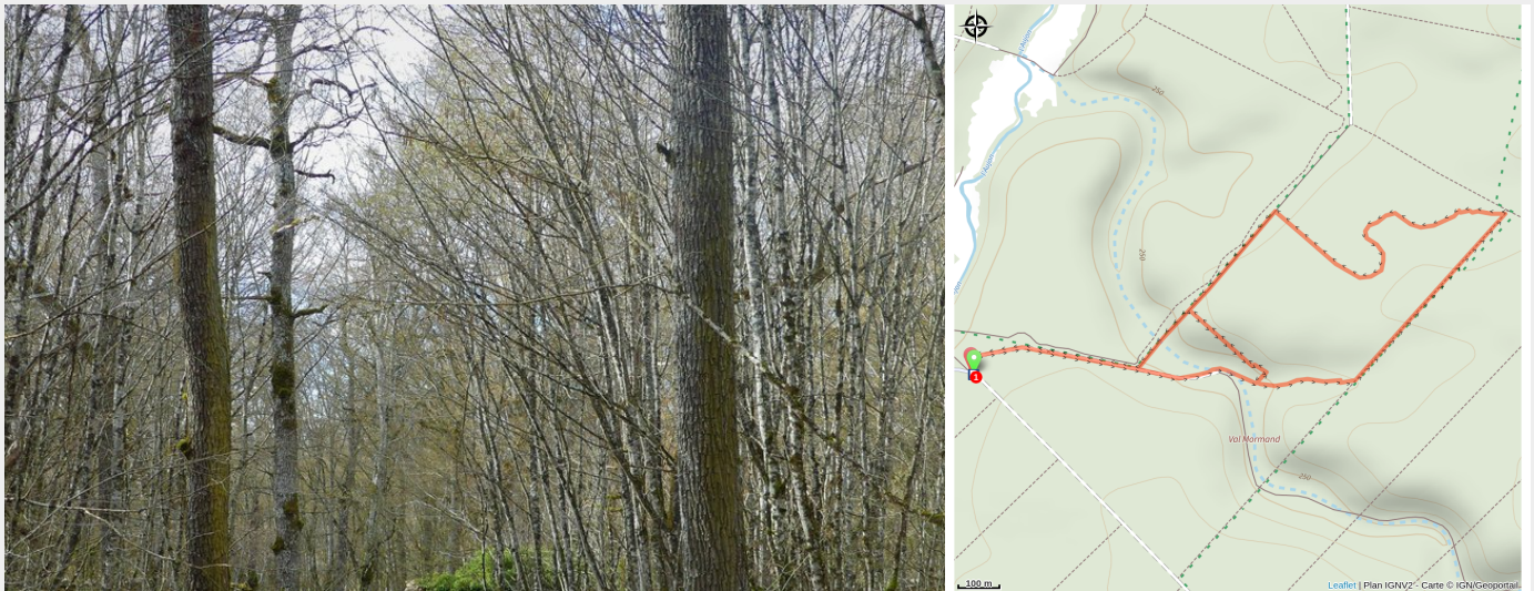
Promeneurs dans la forêt d'Arc-Châteauvillain

Partez pour une découverte immersive et artistique du massif forestier d'Arc-Châteauvillain grâce à cet itinéraire ponctué d'œuvres d'art. Entre le Parc aux Daims et la Réserve intégrale, cette forêt remarquable vous offrira une atmosphère paisible pour admirer ce parcours d'art.