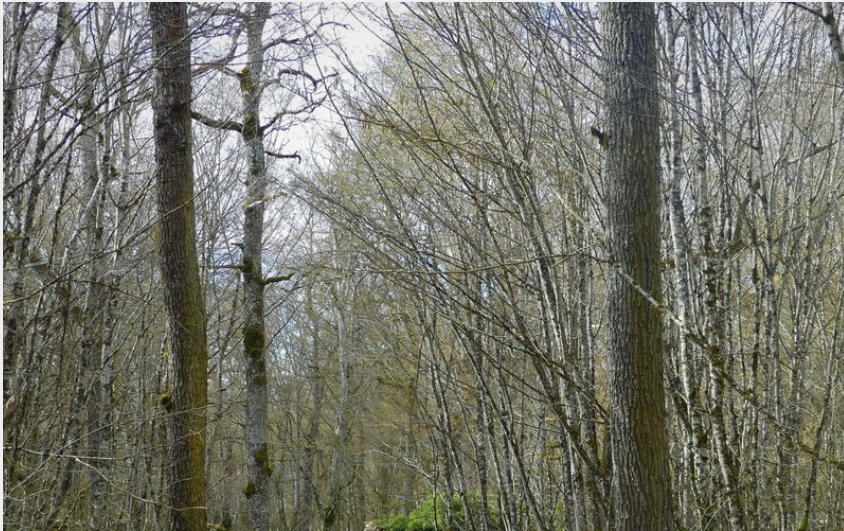
Promeneurs dans la forêt d'Arc-Châteauvillain