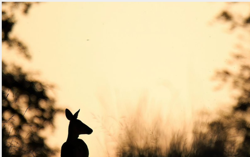
Chevreuil en forêt