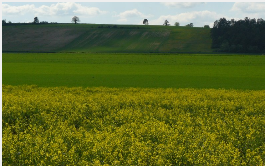
Cuesta châillonnaise