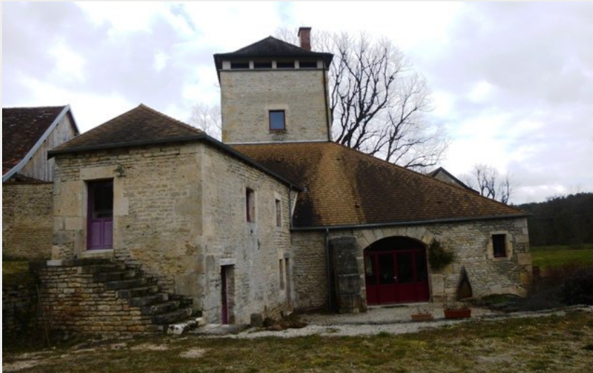
Haut-fourneau de Froidvent