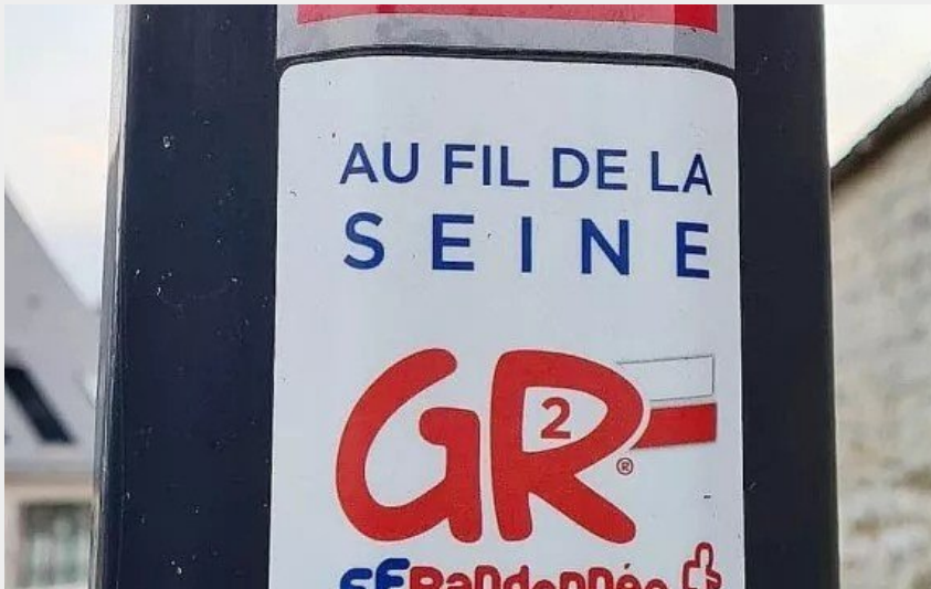
Logo GR2 - Au fil de la Seine