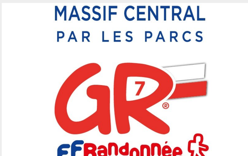
Logo GR7 - Traversée du Massif Central