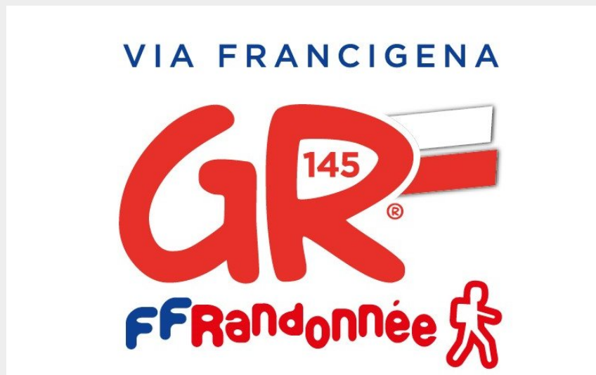
Logo GR145 - Via Francigena