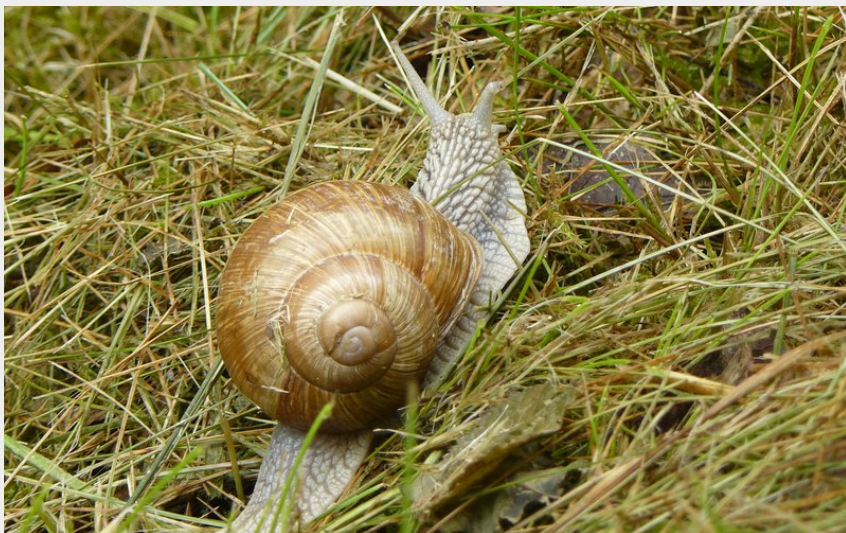
Escargot de Bourgogne