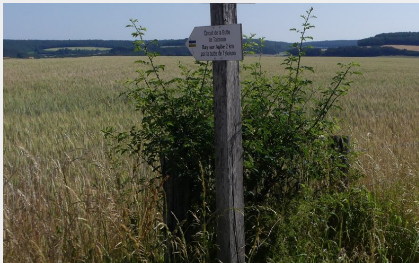
Sentier de la Butte de Taloisson