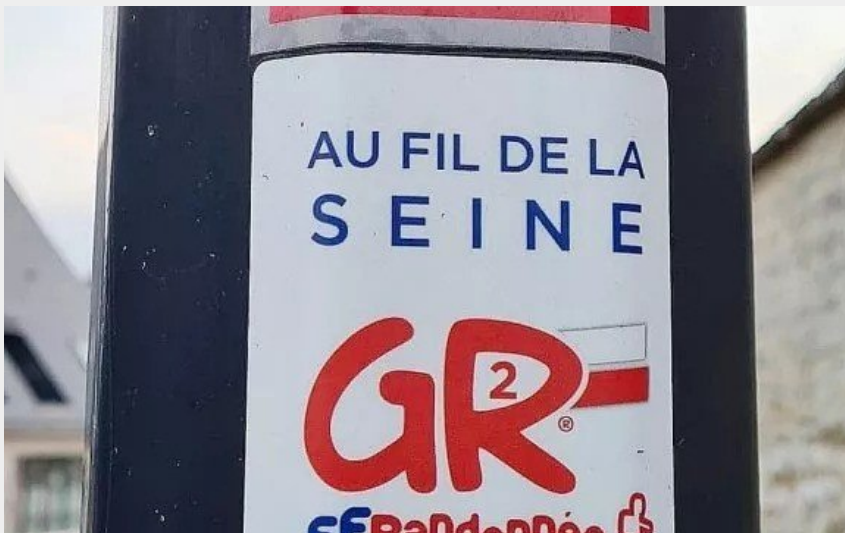
Logo GR2 - Au fil de la Seine (© FFRP)