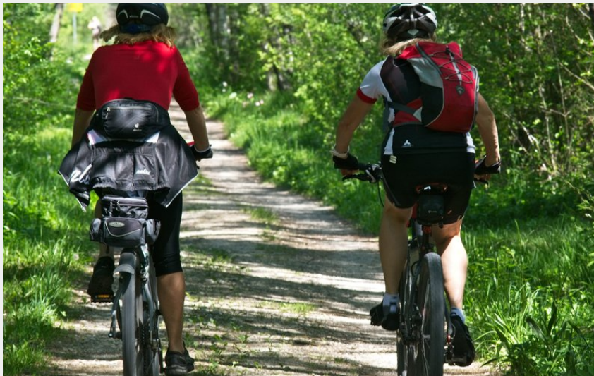
Cyclistes en forêt