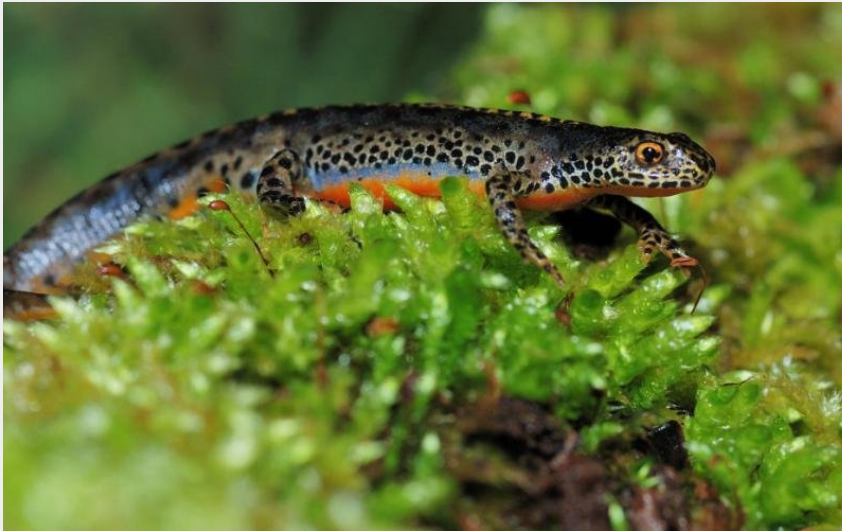
Triton alpestre