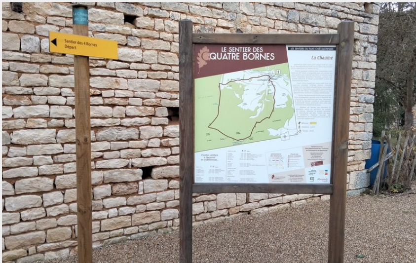
Départ du sentier des Quatre Bornes (Mairie de La Chaume)