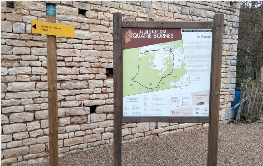
Départ du sentier des Quatre Bornes (Mairie de La Chaume)