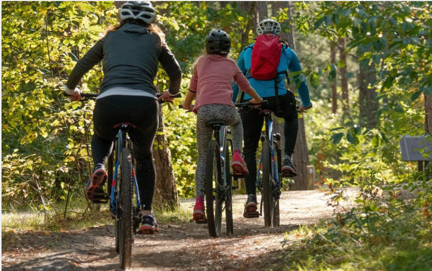
Cyclistes en forêt