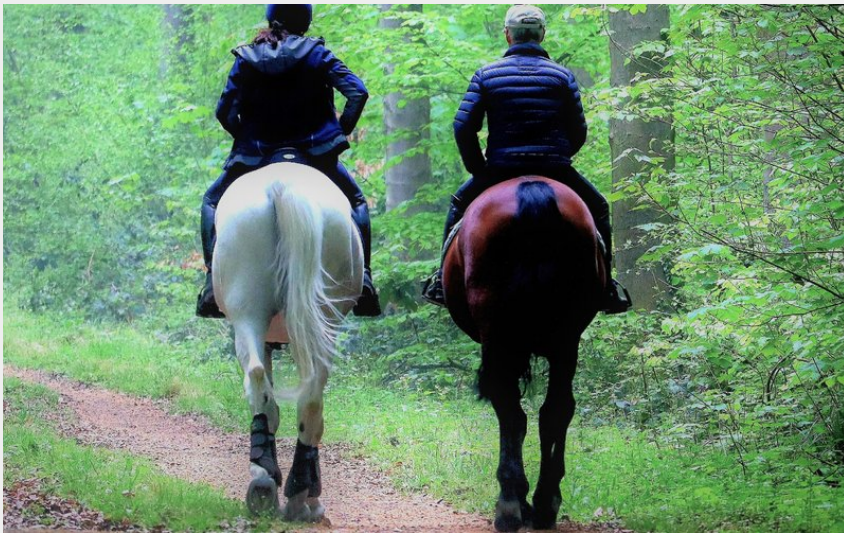
Cavaliers en forêt