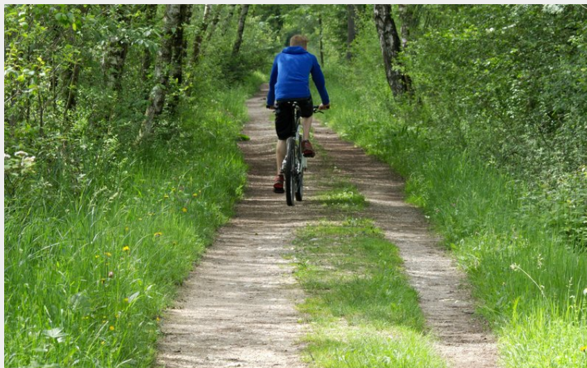
Cycliste en forêt