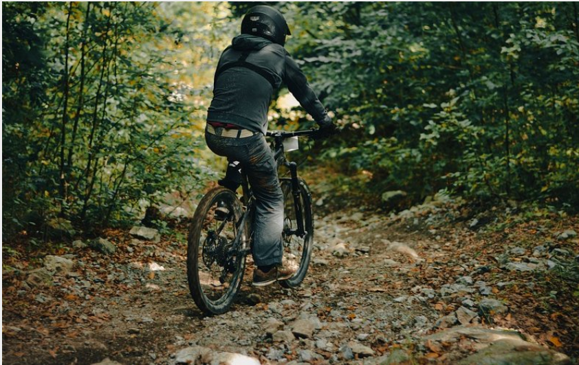
Cycliste en forêt