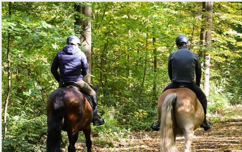
Cavaliers en forêt