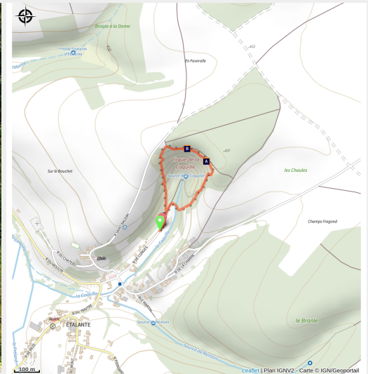
Cirque de la Coquille

Le Cirque de la Coquille est un site naturel remarquable et particulier du Châtillonnais. Il est géré depuis 1995 par le Conservatoire d'Espaces Naturels de Bourgogne qui en assure la gestion et la valorisation.