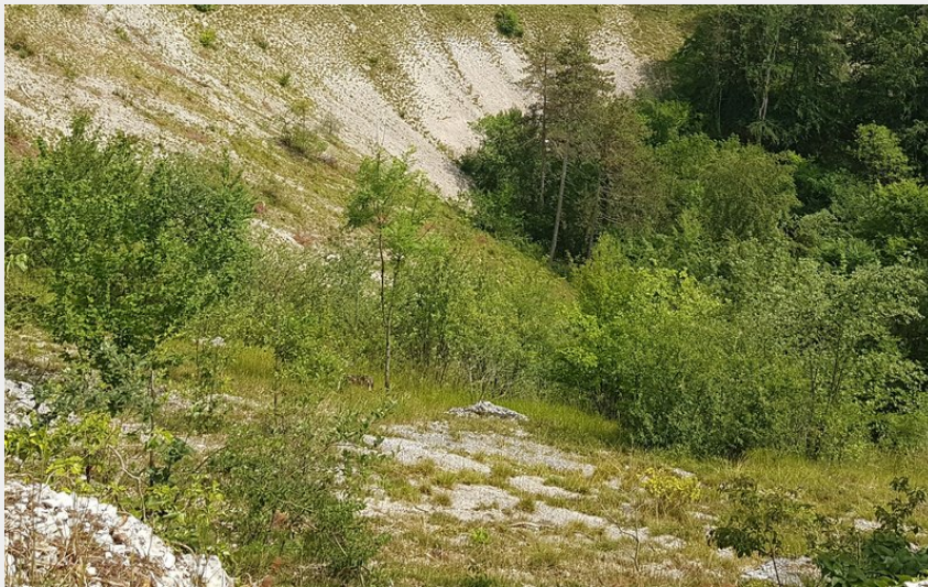
Cirque de la Coquille